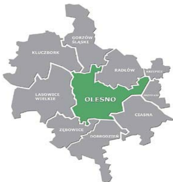
Rysunek 1. Gmina Olesno na tle sąsiednich gmin